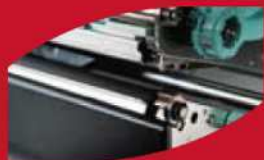
Pohyblivý senzor etiket