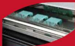
Snadná výměna tiskové hlavy