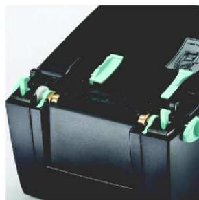
Senzor umožňují tisk na malé etikety