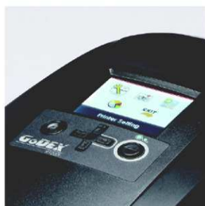
Barevný TFT displej pro snadné ovládání

Termotransferové tiskárny RT200i jsou díky svému vybavení schopny dosahovat velmi vysokého výkonu