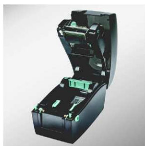
Senzor umožňující tisk na malé etikety