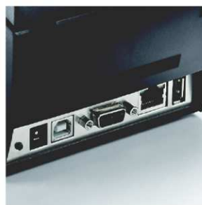
USB, Ethernet, Serial USB Host pro připojení klávesnice nebo flash paměti