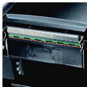
Technologie dvou senzorů umožňuje použití různých druhů spotřebního materiálu