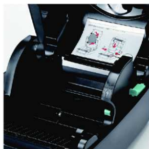
Bohyblivý držák etiket umožňuje snadné zakládání etiket