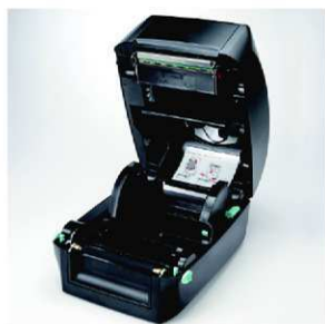
Moderní konstrukce a snadná obsluha

Tiskárna je určena pro lehké a středně těžké provozy. Reflektivní čidlo posuvné po celé šířce tiskové zóny umožňuje tisk na nejrůznější tvary etiket.