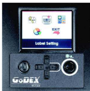
Moderní konstrukce a snadná obsluha

Termotransferové tiskárny RT700i jsou díky svému vybavení schopny dosahovat velmi vysokého výkonu Reflektivní čidlo posuvné po celé šířce tiskové zóny umožňuje tisk na nejrůznější tvary etiket.