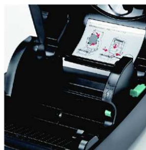
Bohyblivý držák etiket umožňuje snadné zakládání etiket