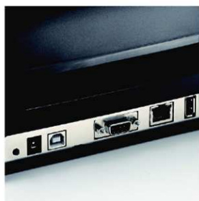
USB, Ethernet, Serial USB Host pro připojení klávesnice nebo flash paměti